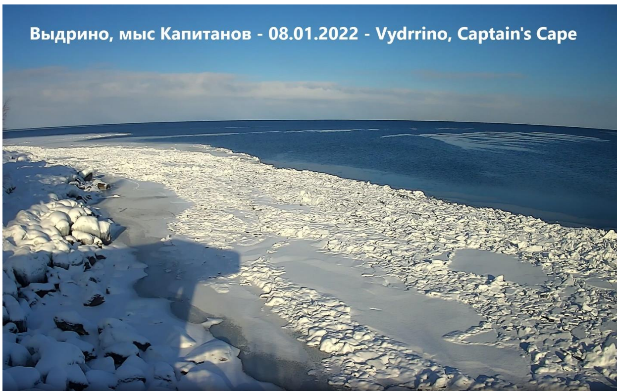
Выдрино, мыс Капитанов - 08.01.2022 - Vydrino, Captain's Cape