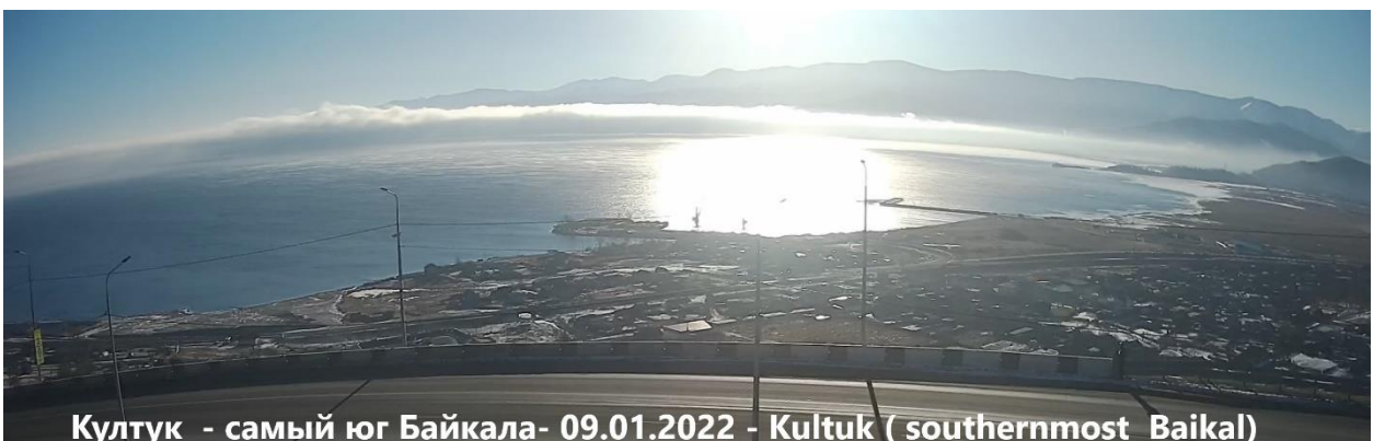
Култук - самый юг Байкала- 09.01.2022 - Kultuk ( southernmost Baikal)