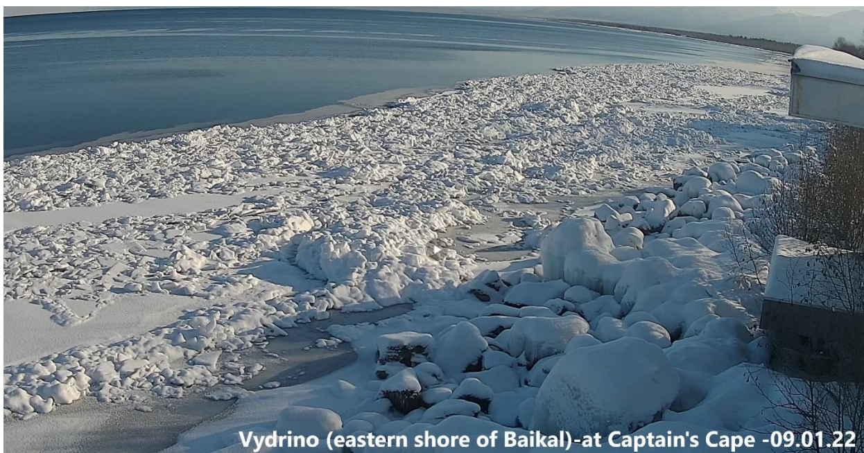
Vydrino (eastern shore of Baikal)-at Captain's Cape -09.01.22