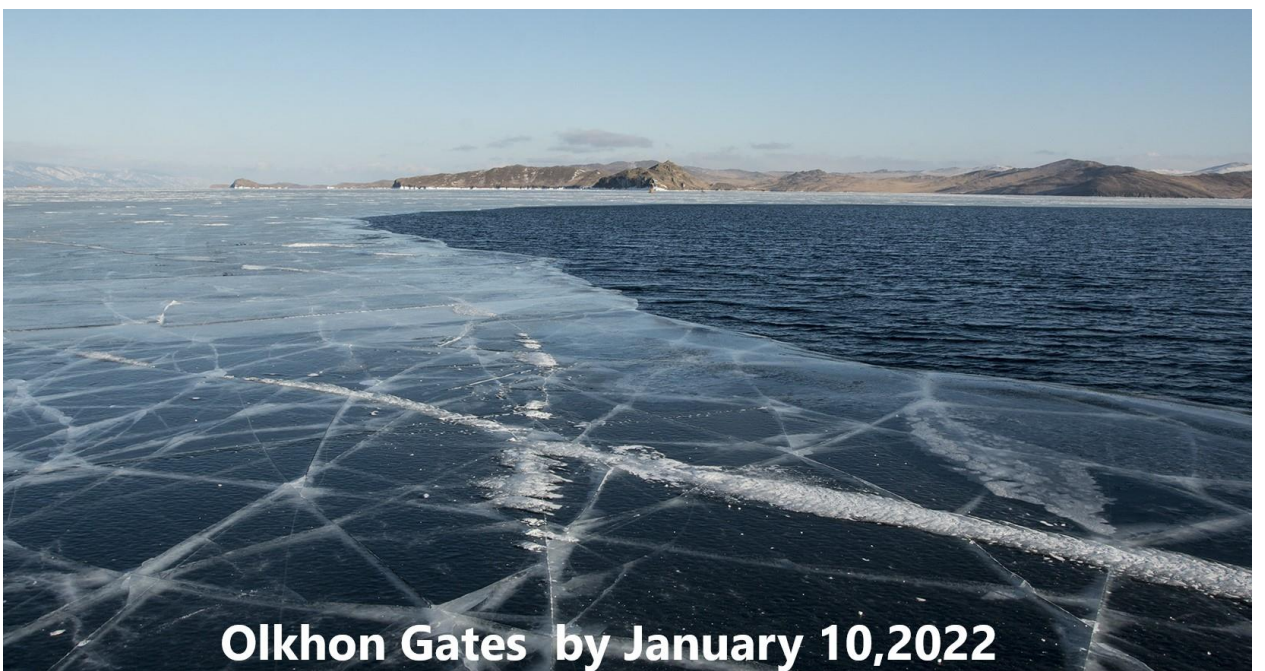
Olkhon Gates by January 10, 2022