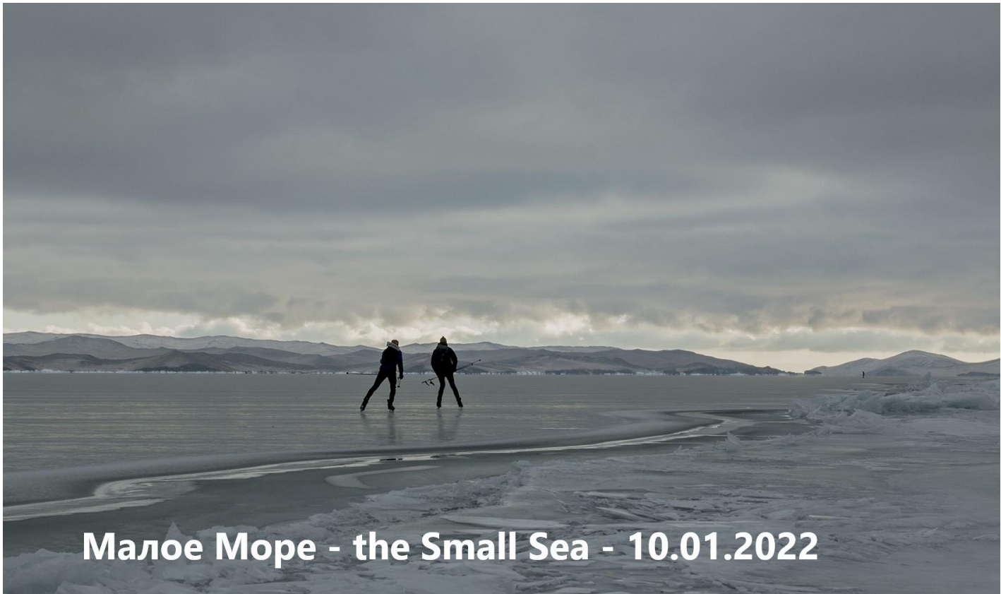
Малое Море - the Small Sea - 10.01.2022