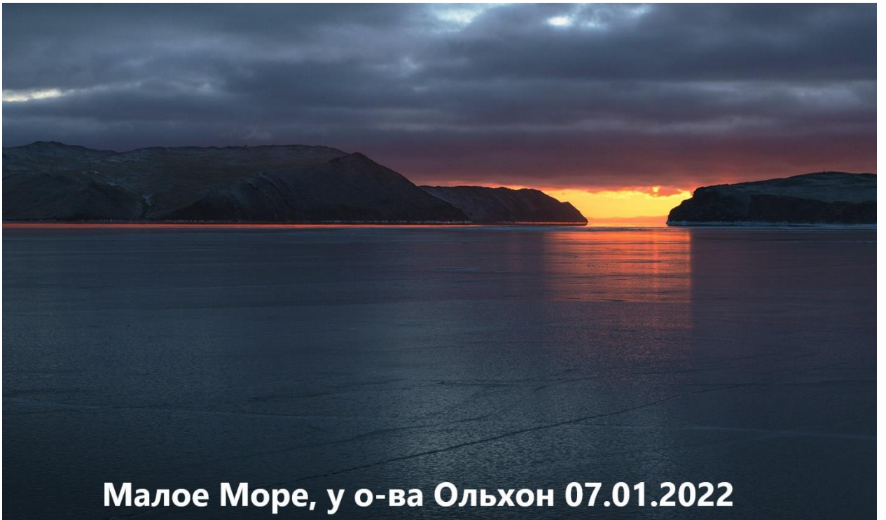
Малое Море, у о-ва Ольхон 07.01.2022